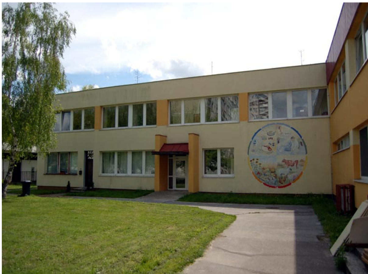
budova školy na Harmincovej ul. 1