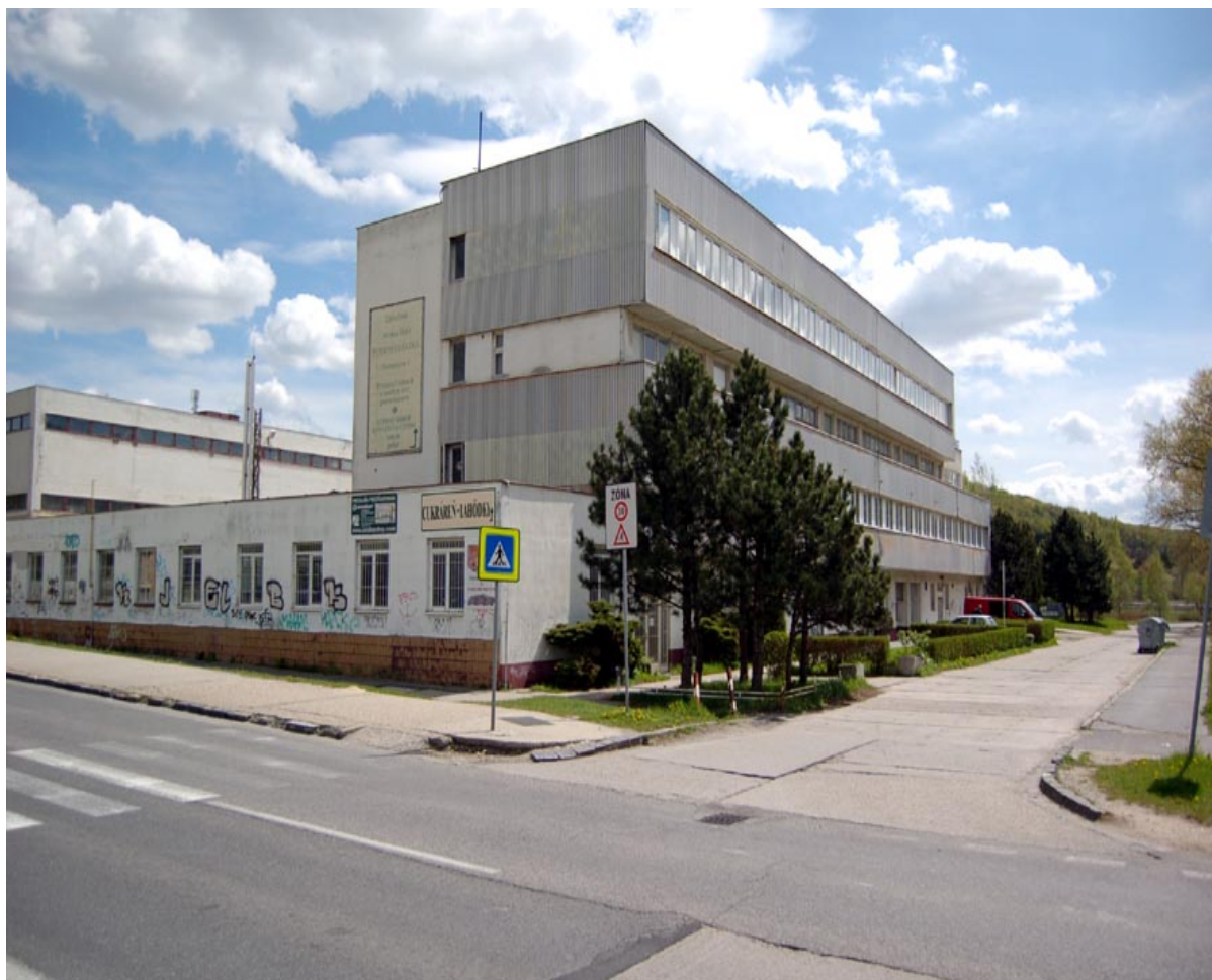
budova praktického vyučovania Na pántoch 20